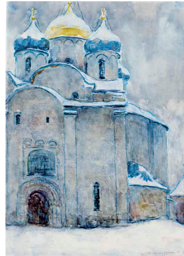
Pustovojtov, Sophienkathedrale, 1972 ▶