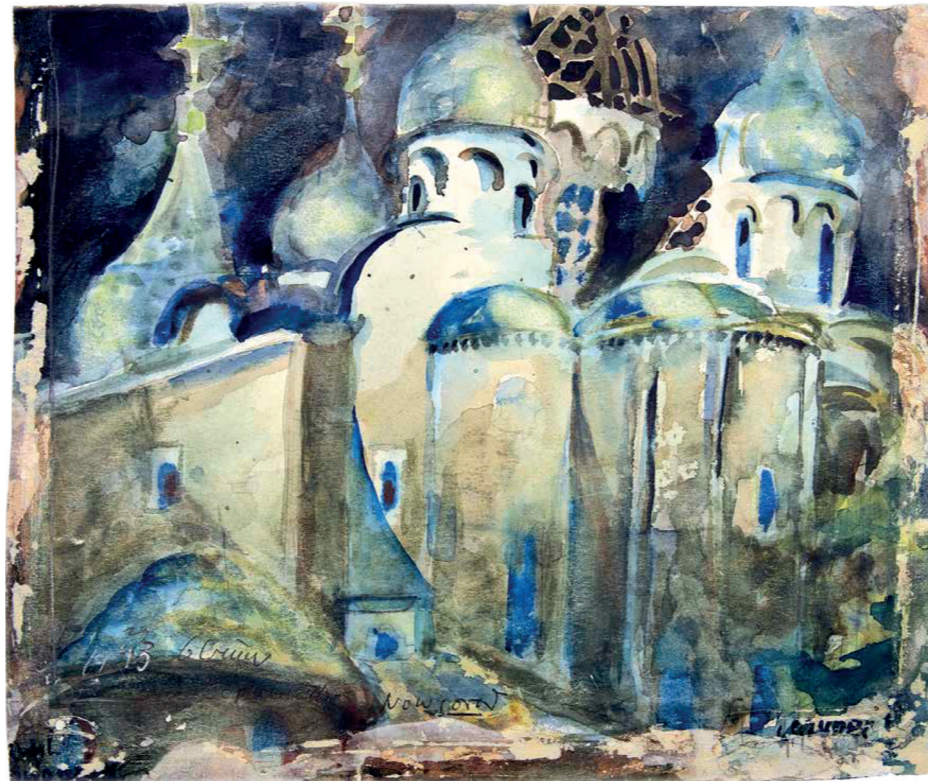
Sophienkathedrale, Nowgorod 1942/43